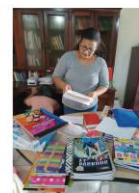
Distribuzione Materiale Scolastico