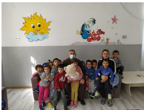
Un bel ricordo

L'orfanotrofio di recente è stato chiuso, i bambini sono stati distribuiti in altri centri ed è in corso la trasformazione della struttura in un Centro Sociale.