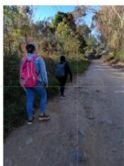
Le strade verso la scuola in alcune zone

Le infrastrutture mancano e spesso raggiungere la Scuola per bambini ed insegnanti è una quotidiana fatica, richiede talvolta ore di cammino in sentieri sconnessi.