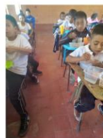
Una «novità»: pranzo a Scuola !!